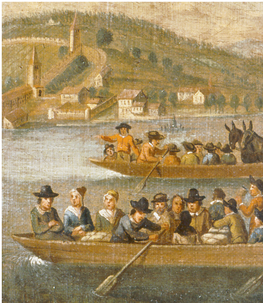
Flucht übers Wasser: So komfortabel wie diese Glaubensflüchtlinge auf dem Zürichsee hatten es die Hugenotten bei Aarberg bei Weitem nicht.

Doch nun nochmal zurück in die Schweiz und den Kanton Bern, der sich damals vom Genfersee bis weit in den heutigen Aargau erstreckte und demnach eine gewichtige Rolle bei der Bewältigung der Flüchtlingsströme auf dem Land- wie auch auf dem Wasserweg spielte. Zuständiges Organ der Obrigkeit war die sogenannte Exulantenkammer, welche die ankommenden Flüchtlinge zur vorübergehenden Aufnahme auf die Ämter verteilte. Die Landvögte wiederum verteilten sie