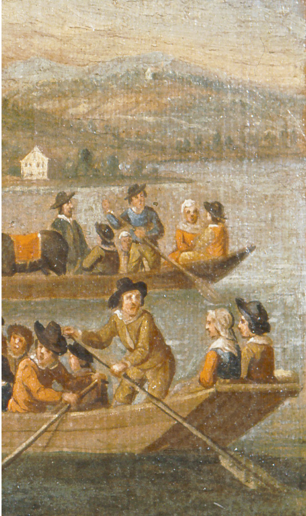
Die Unfallboote waren hoffnungslos überfüllt. Tafelmalerei, 17. Jahrhundert. Privatbesitz, Foto E. Widmer, Zürich

«Auf den Spuren der Hugenotten und Waldenser» eröffnet. Er zeigt auf, was die aus Frankreich und Italien Schiffunglück mit 111 Toten.